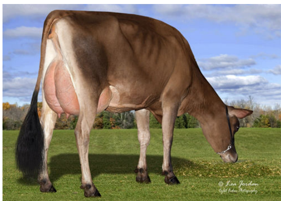
JX GENERATIONS JAMMER DORA {5}